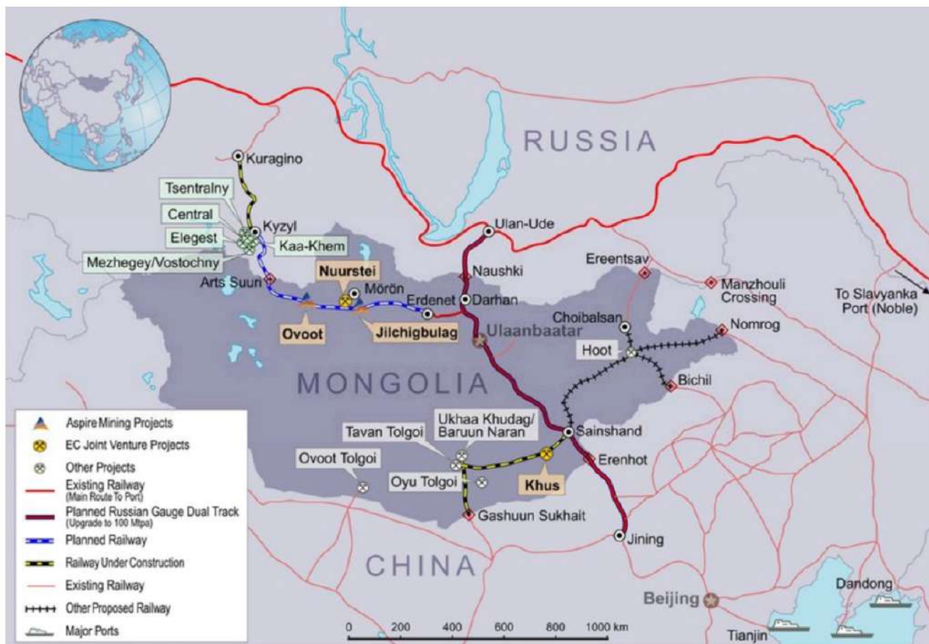
Рис. 2. Карта КМРЭЖ из монгольских источников (ограниченная территория монголии и окрестностей).

Согласно российской официальной версии (и монгольской прессе), стороны согласовали список из 32 проектов по приоритетным направлениям сотрудничества. При этом на церемонии подписания президент Монголии жестко заявил, что лучше выбрать для немедленной реализации два-три проекта, чем бесконечно обсуждать длинный список, а китайская сторона не опубликовала никакого списка. Уполномоченные органы Сторон (Минэкономразвития РФ, МИД Монголии и ГКРР КНР) не реже одного раза в год проводят встречи с целью мониторинга исполнения Программы и согласования необходимых мероприятий. Стороны так и не преуспели в создании совместного инвестиционного центра для подготовки технико-экономического обоснования проектов. Не проводились и общественные обсуждения проекта Программы, что очевидно снизило её качество и легитимность.